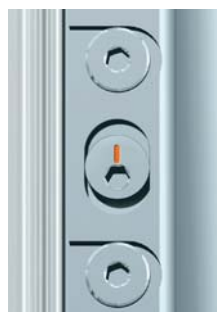
Nollställning zero position Nullstellung